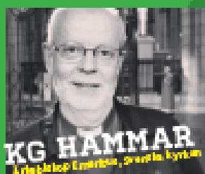
KG HAMMAR Arbetslöshetskommissionen, Svenska kyrkan

Fyra föreläsningar om synen på och användningen av vår natur.